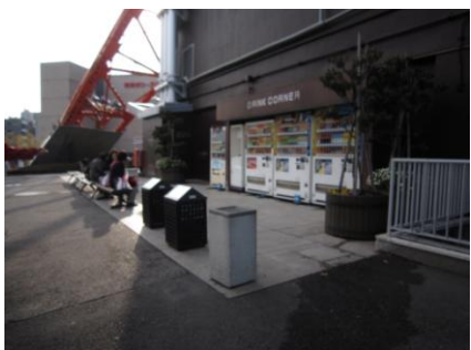
喫煙スペース施工前