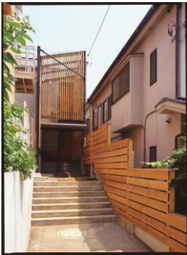
エントランス施工前